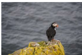
Refuge de Breiðavík - ⌚ 6h Bakkagerði