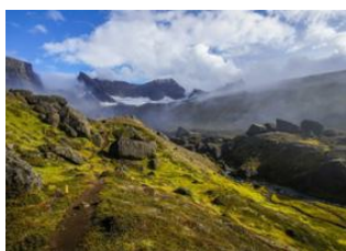
Bakkagerði - ⌚ 6h 30m Bakkagerði