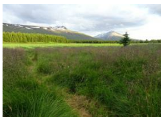
Bakkagerði 🚗 70km - ⌚ 1h Egilsstaðir