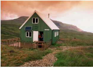
Refuge de Loðmundarfjörður - ⌚ 6h Refuge de Húsavík