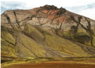
Refuge de Húsavík - ⌚ 5h 30m Refuge de Breiðavík